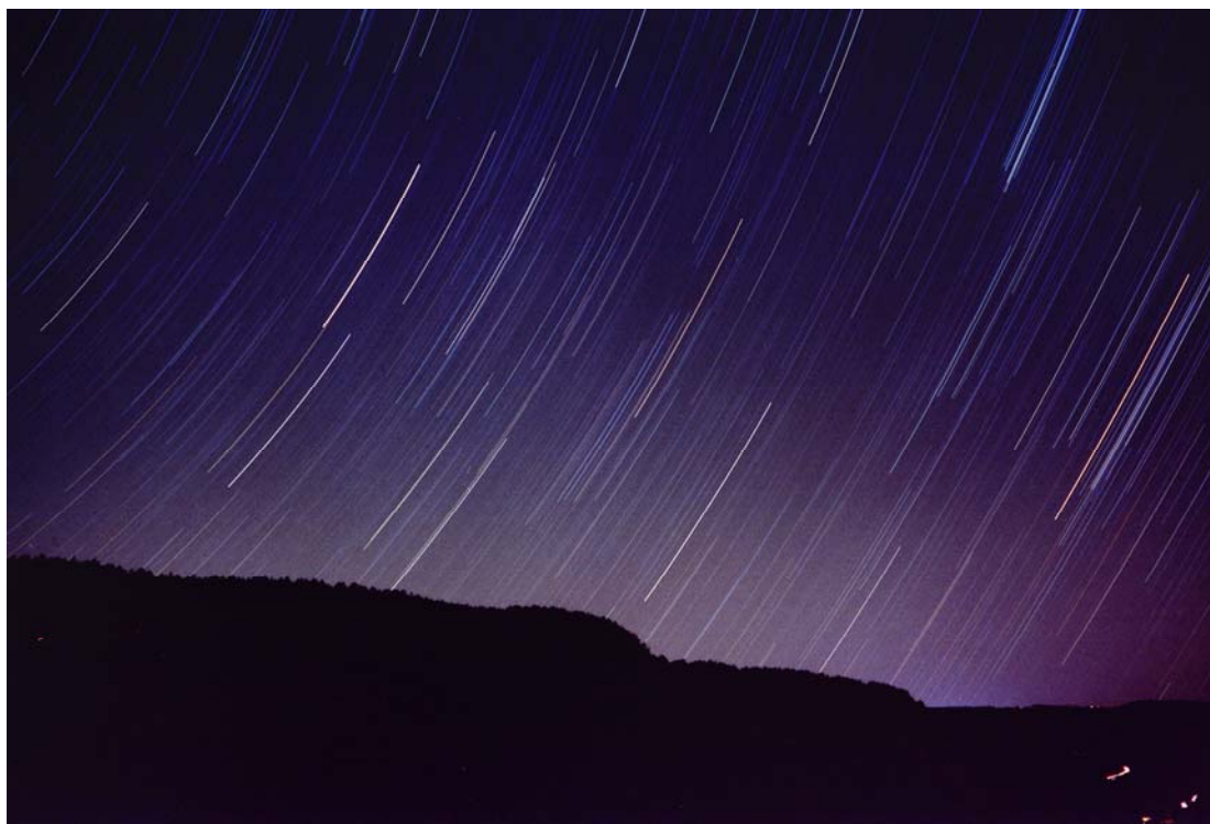
Le tracce stellari lasciate dopo 45 minuti di posa a f/4 con un obiettivo di 35mm su pellicola di 400 ISO.

Per evidenziare la rotazione della volta celeste stellata, basta sistemare la fotocamera su un treppiedi, fare scattare l'otturatore via cavo e lasciarlo aperto diversi minuti, anche fino a 10-15 minuti per pose digitali, usando basse sensibilità, come 100 ISO, e diaframmi piuttosto aperti, come 2.8 o 4. Con le pellicole la posa deve essere unica, anche di diverse ore, mentre in digitale si sommeranno diverse foto al computer, sempre per ottenere come risultato finale delle strisce lasciate dalle stelle più luminose nel cielo notturno. Per quanto riguarda le pellicole da utilizzare (fresche e ben conservate), è opportuno sceglierne una piuttosto sensibile 400-1600 ISO, se invece si vogliono ottenere stelle puntiformi. Inoltre, quando si porta a sviluppare il rullino, occorre specificare che si tratta di foto astronomiche senza margini ben definiti e che si devono sviluppare senza tagliare la pellicola (si dice sviluppo in striscia). Durante la fase dello sviluppo, infatti, il macchinario o l'operatore potrebbero tagliare a metà una foto, perché fanno fatica a distinguere lo spazio vuoto tra due fotogrammi e lo sfondo del cielo, solitamente sempre nero. Il tempo di posa limite in minuti è dato dalla seguente tabella, per un cielo buio, limpido e senza Luna. Si tiene conto anche del difetto di reciprocità delle pellicole impiegate.