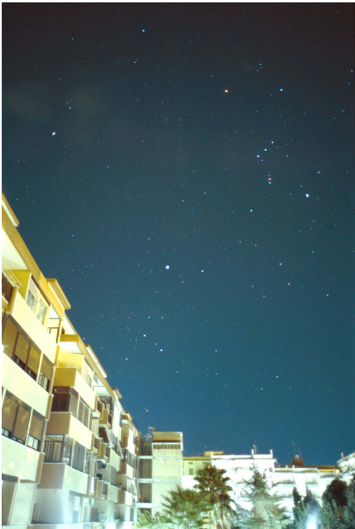
Stelle sopra la città fotografate con un obiettivo di 24mm aperto a f/2 per 30 secondi e pellicola di 800 ISO.