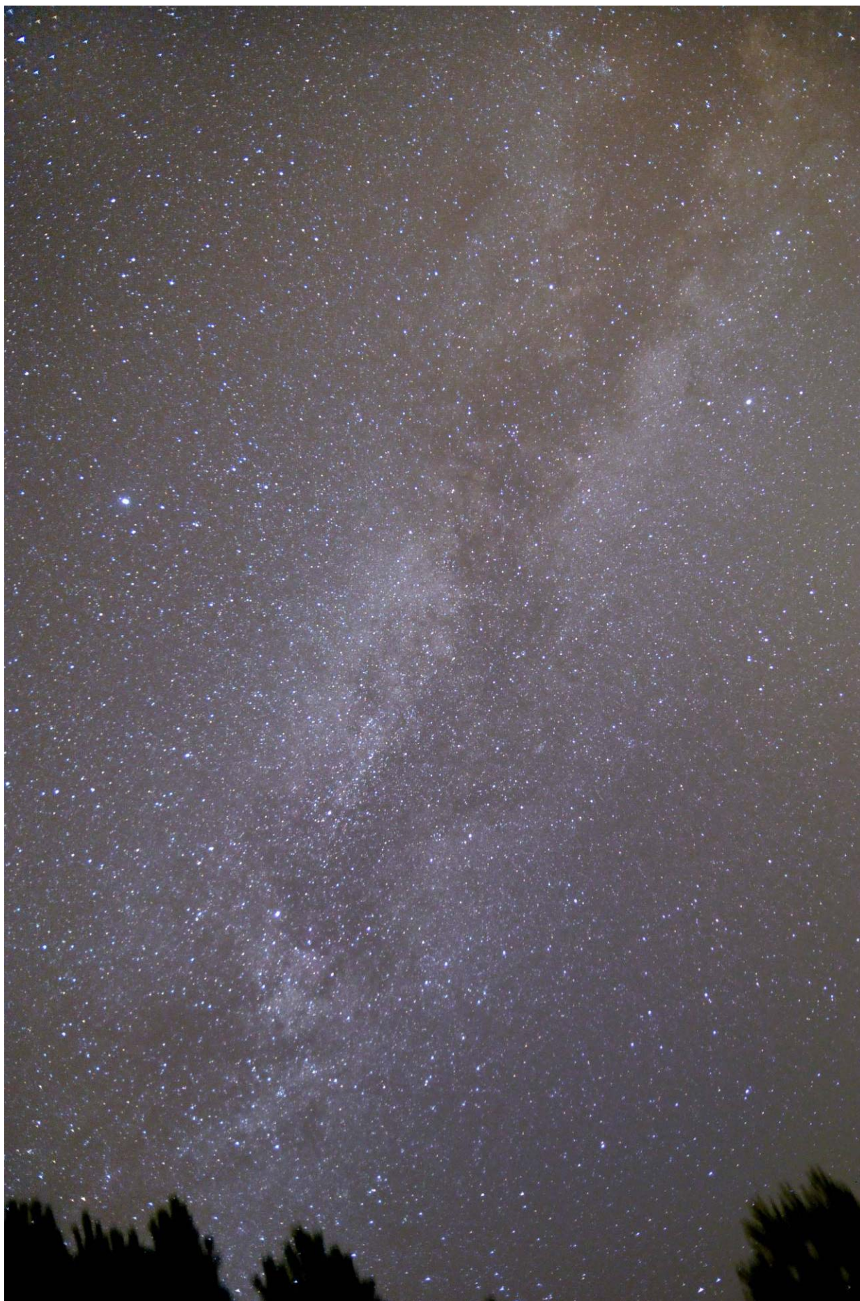
La Via Lattea estiva con un obiettivo di 18mm a f/2,8 e posa di 3 minuti a 1000 ISO.