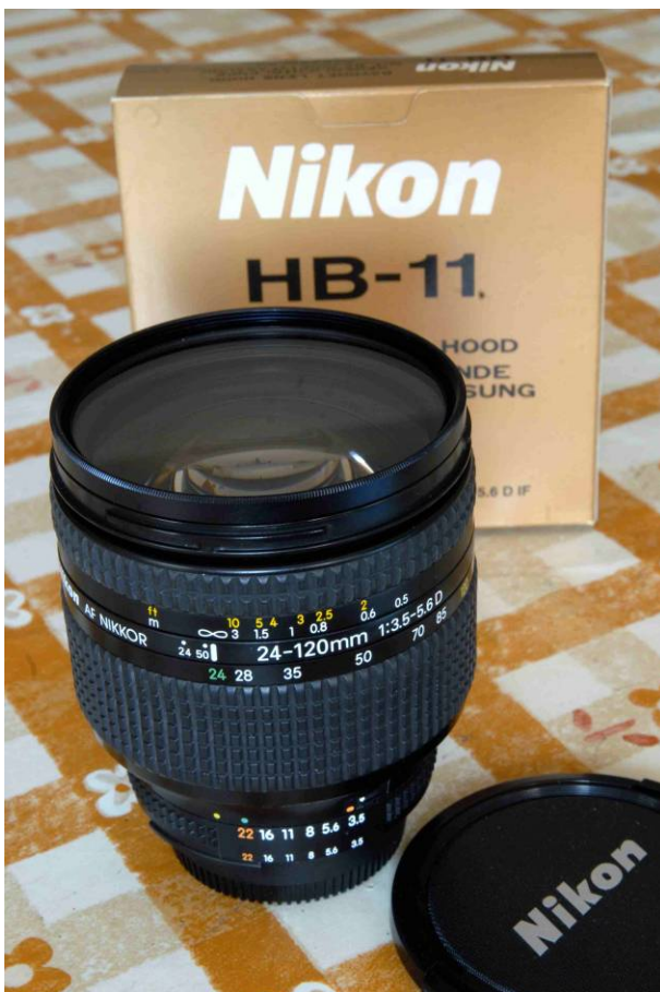
Un obiettivo zoom autofocus ed asferico.