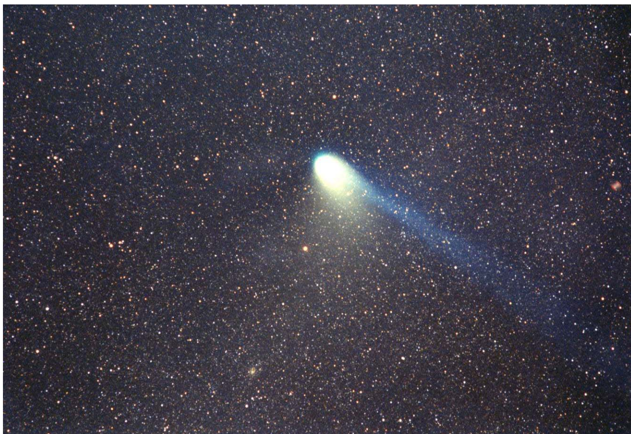
Cometa Hale-Bopp. Obiettivo di 300mm aperto a f/2,8 per 10 minuti con pellicola di 800 ISO.

La fotografia astronomica a vasto campo si occupa delle costellazioni, degli oggetti del profondo cielo (nebulose, ammassi stellari, galassie), della Via Lattea, delle meteore e delle comete. La lunghezza focale F dell'obiettivo determina l'ampiezza del campo inquadrato, che deve essere scelto in relazione alle dimensioni dell'oggetto da fotografare. Per la Via Lattea, presa da una parte all'altra dell'orizzonte, occorre adoperare focali da 8mm a 17mm di tipo fish-eye (occhio di pesce, 180^\circ di campo inquadrato). Per ingrandire alcune parti occorrerà un 50mm oppure un 85mm, o più, mentre per avere sul fotogramma anche i particolari del paesaggio sarà utile un super-grandangolare di 14-20mm. Se si vuole fotografare invece la nebulosa di Orione ci vorrà una focale superiore ai 300mm. La tabella riporta le dimensioni angolari del campo inquadrato da ogni obiettivo sul fotogramma 24 \times 36 mm del piccolo formato 35mm. Naturalmente, si possono adoperare formati più ampi, o più piccoli, come il formato APS (1,5-1,6 volte più piccolo del 35mm).