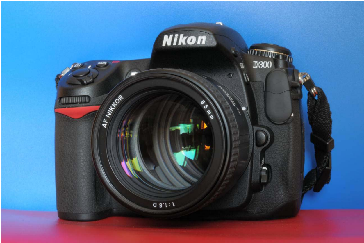
Una reflex digitale moderna.

Oltre agli obiettivi a focale fissa, vi sono quelli a focale variabile, meglio noti come zoom ; con essi non sempre esistono dei vantaggi, i principali punti critici sono i seguenti: