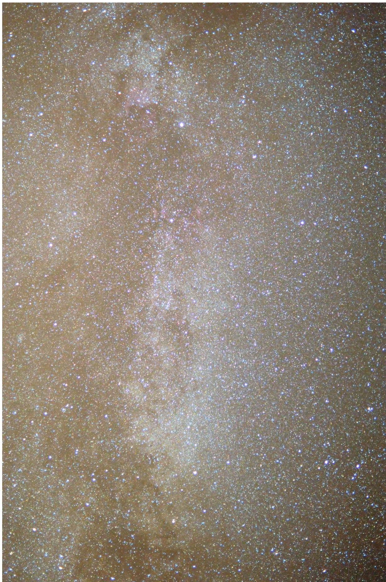
Via Lattea nella costellazione del cigno con obiettivo 35mm f/2 e 1,5 minuti a 1000 ISO.