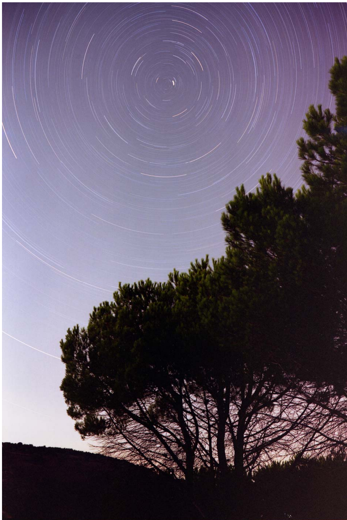
Rotazione delle stelle attorno al polo celeste nord ottenuta con un obiettivo di 35mm chiuso a f/4 su pellicola di 200 ISO e posa di 2 ore.