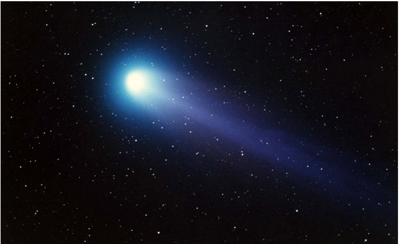
La cometa Hyakutake, apparsa nel 1996, fotografata con un obiettivo di 300mm a f/2,8 su pellicola di 800 ISO con una posa della durata di 8 minuti.