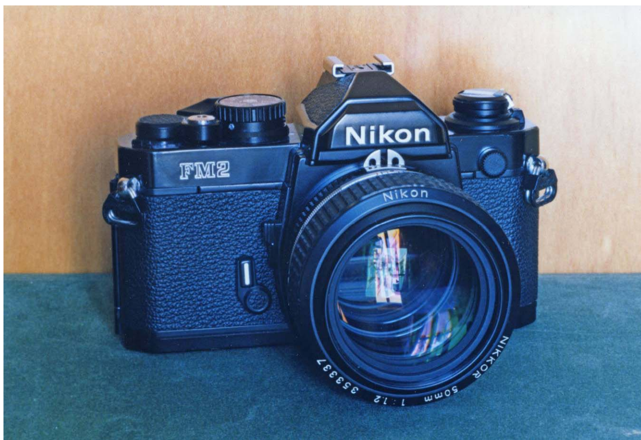
Una macchina fotografica reflex 35mm per il formato 24×36mm a pellicola.